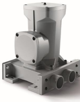
Abb. 1: Einzelsystem inkl. Basismodul

ProVent 2 500 Systeme sind sowohl für die Erstausrüstung als auch für die Nachrüstung konzipiert. Nachfolgende Abbildungen zeigen mögliche Aufbauten sowie ein Querschnitt des Systems.