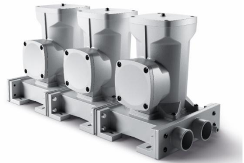
Abb. 2: Modularer Aufbau inkl. Basismodul